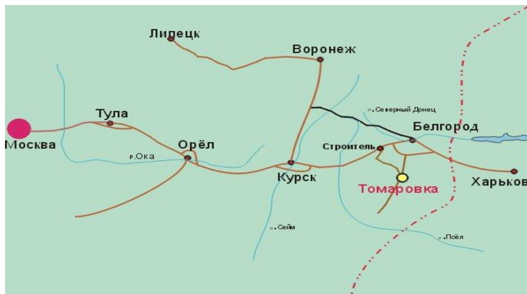
Рисунок 5. Расположение ЗАО «Томмолоко» Яковлевского района Белгородской области