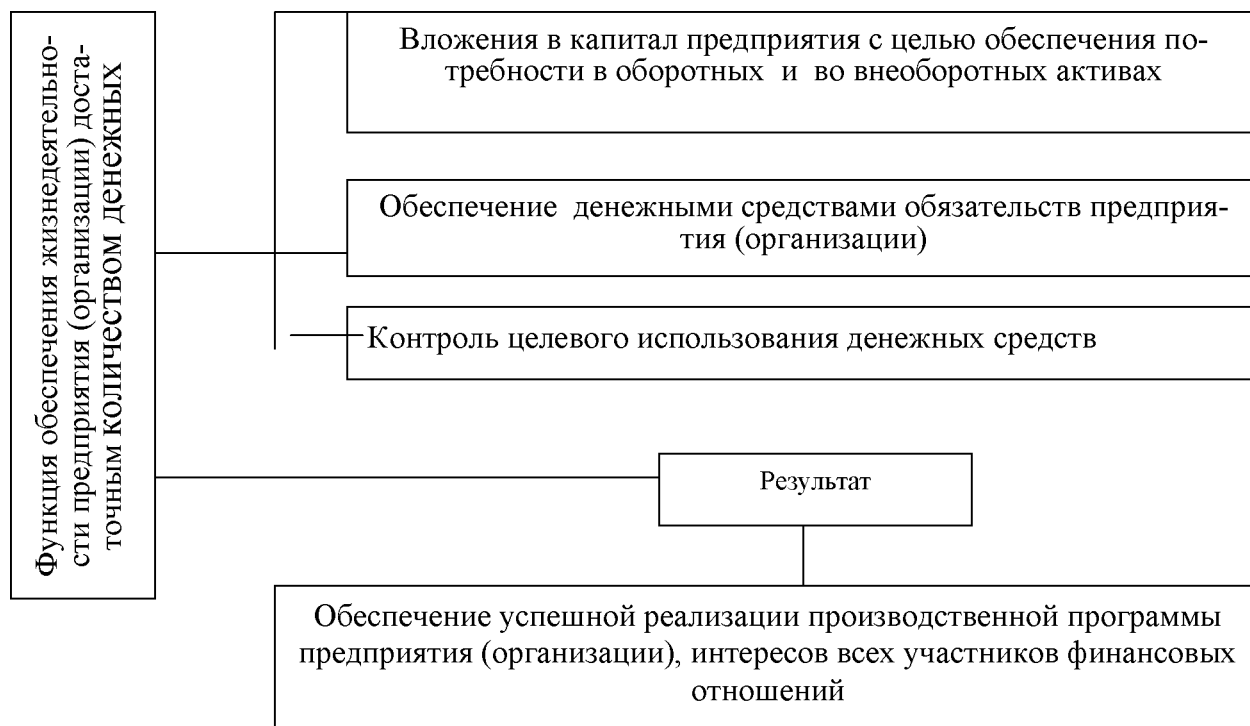
Рисунок 1. Функция обеспечения жизнедеятельности предприятия (организации) достаточным количеством денежных средств

Перечислите основные объективные и субъективные функции финансов. При характеристике функций используйте данные рисунка 1.