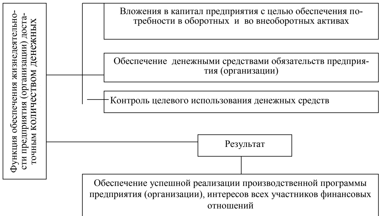
Рисунок 1. Функция обеспечения жизнедеятельности предприятия (организации) достаточным количеством денежных средств

Перечислите основные объективные и субъективные функции финансов. При характеристике функций используйте данные рисунка 1.