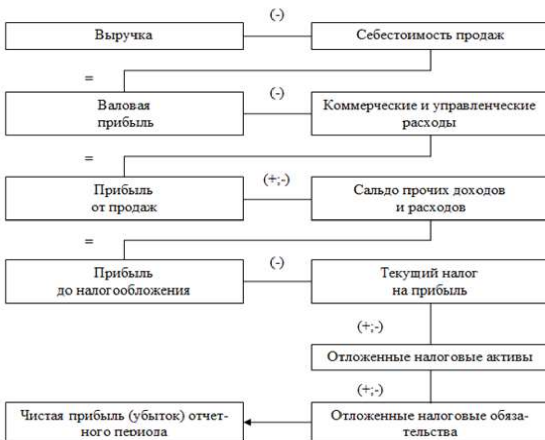
Рисунок 1. Алгоритм формирования финансовых результатов организации

Доходность, т.е. прибыльность предприятия, может быть оценена при помощи как абсолютных, так и относительных показателей. Абсолютные показатели выражают прибыль, и измеряются в стоимостном выражении, т.е. в рублях. Относительные показатели характеризуют рентабельность и измеряются в процентах или в виде коэффициентов.