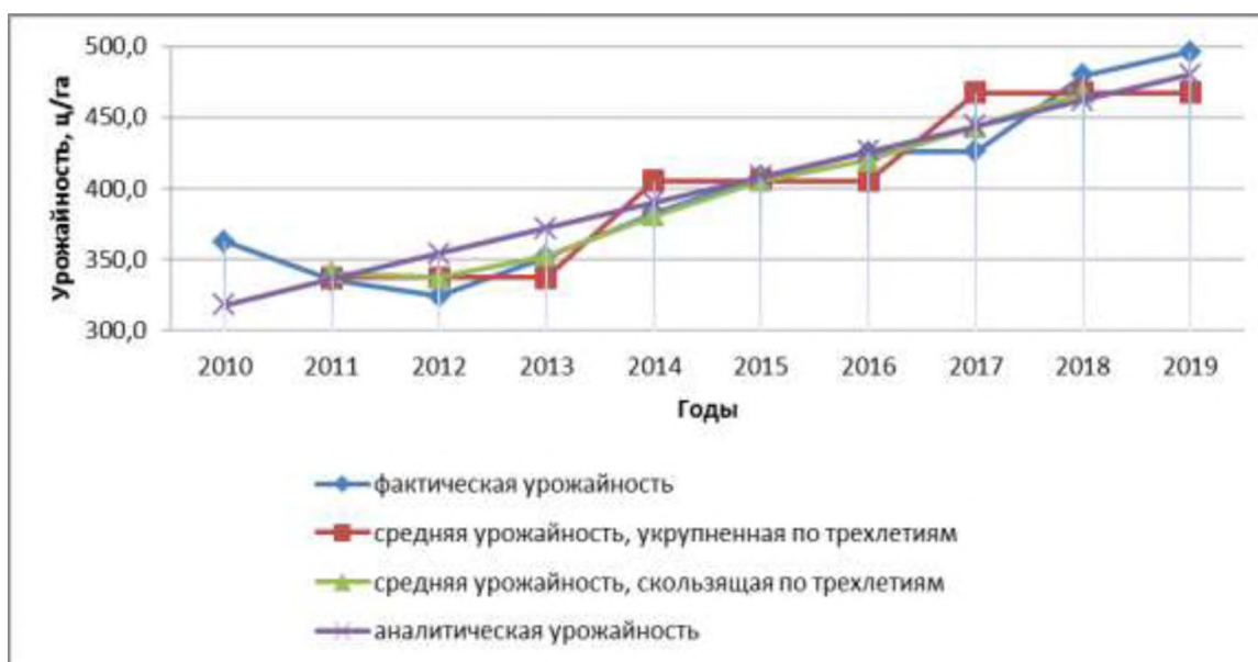
Рисунок 2 -Динамика урожайности сахарной свеклы за 2010-2019 гг.