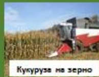
Кукуруза на зерно