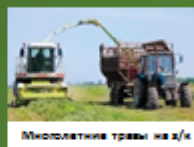
Многолетние травы на з/к