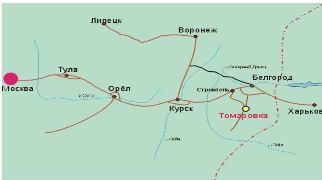
Рисунок 5. Расположение ЗАО «Томмолоко» Яковлевского района Белгородской области