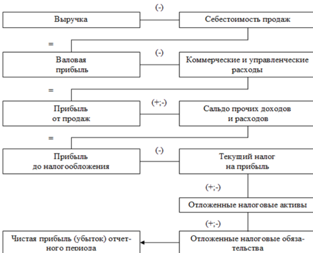
Рисунок 1. Алгоритм формирования финансовых результатов организации

даж, прибыль от прочих доходов и расходов, прибыль до налогообложения и чистая прибыль организации. Последовательность их формирования представлена на рисунке 4.