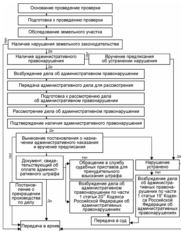
Последовательность административных процедур при исполнении Федеральным агентством кадастра объектов недвижимости государственной функции по осуществлению государственного земельного контроля